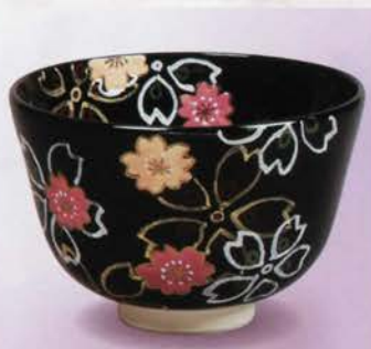
1-117 茶碗 黒仁清 桜 田中香泉作(化粧箱) ¥6,264 (本体¥5,800)