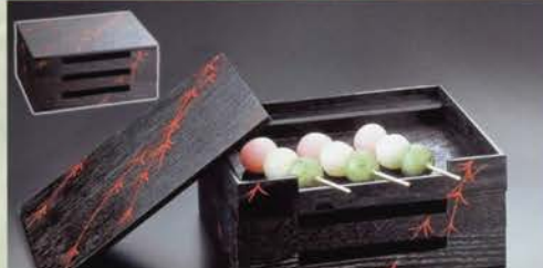
4-120 田楽箱 柳蒔絵 (縦16×横23×H 11cm) (化粧箱) ¥14,580 (本体¥13,500)