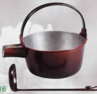
6-116 銅 汁器 手造り打ち出し 一政堂 (桐箱) ¥118,800 (本体¥110,000)