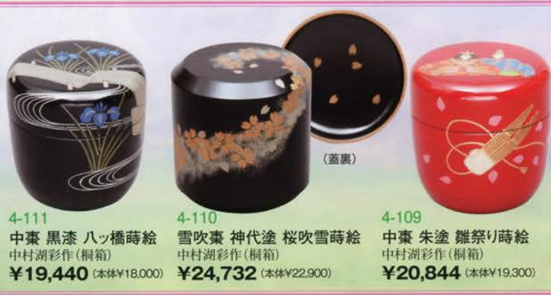
4-111 中棗 黒漆 ハッ橋蒔絵 中村湖彩作(桐箱) ¥19,440 (本体¥18,000)