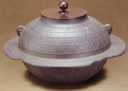
6-126 透木釜 桜川 菊地政光作 (桐箱) ¥118,000 (本体¥109,259)