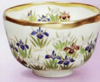
2-102 茶碗 仁清 あやめ 山岡善高作(桐箱) ¥23,760 (本体¥22,000)