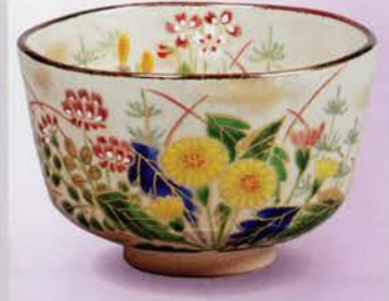
2-112 茶碗 乾山 春野 老休窯(桐箱) ¥15,552 (本体¥14,400)