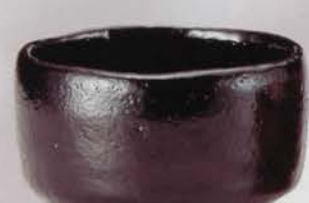
5-103 茶碗 東陽坊 長次郎写 佐々木昭楽作(桐箱) ¥21,168 (本体¥19,600)