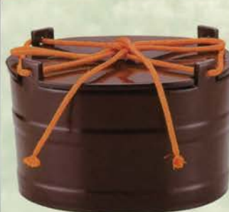
4-119 鯉桶水指ウルミ塗 鵬雲斎好写 (蓋裏 波蒔絵) 中村宗悦作(桐箱) ¥72,036 (本体¥66,700)