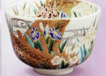
2-104 茶碗 仁清 ハッ橋 加藤如水作(桐箱) ¥28,512 (本体¥26,400)