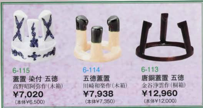
6-115 蓋置 染付 五徳 高野昭阿弥作 (木箱) ¥7,020 (本体¥6,500)