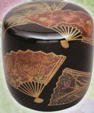
0-103 中棗 黒塗 扇面四君子蒔絵 塚本規義作(桐箱) ¥56,376 (本体¥52,200)