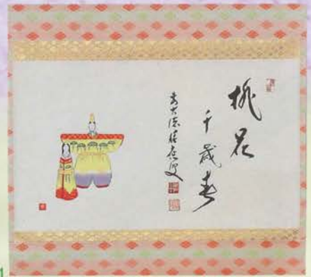
4-101 軸 横物 色絵 立雛の絵「桃花千歳春」 限定10本 福本積應師賛(桐箱) ¥55,620 (本体¥51,500)