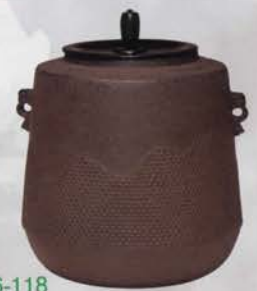
6-118 風炉釜 遠山霞 鷗雲斎好写 菊地政光作 (桐箱) ¥75,000 (本体¥69,444)