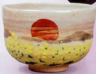
2-111 茶碗 乾山 菜の花 山岡善高作(桐箱) ¥14,796 (本体¥13,700)