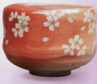
1-103 茶碗 桜 吉村楽入作(桐箱) ¥26,136 (本体¥24,200)

「常照皇寺の境内にある「九重桜」は樹齢四百年になるしだれ桜で、光厳上皇を慰めるために弟の光明天皇が都から持参したものと伝えられています。「九重桜」は国の天然記念物になっており、幹回り4.4m、枝ぶりは最大20mにも達するという巨木です。