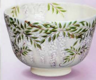
2-118 茶碗 淡青 藤 中村与平作(化粧箱) ¥8,251 (本体¥7,640)