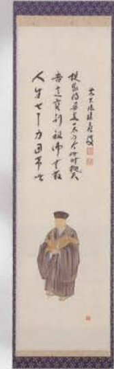
5102 軸 聖物 利休立像 画賛 福本種應師賛(桐箱) ¥66,528 (本体¥61,600)