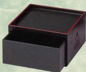
4-121 柏台 淡々斎好写 (21.3cm角×H 12cm) (化粧箱) ¥18,576 (本体¥17,200)