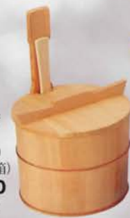
6-110 茶飯用 片手桶飯器 (しゃもじ付) (20×H 22cm) 円二作 (化粧箱) ¥47,520 (本体¥44,000)