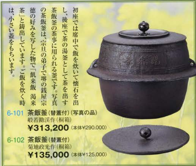
6-101 茶飯釜 (替蓋付) (写真の品) 般若勘溪作 (桐箱) ¥313,200 (本体¥290,000)