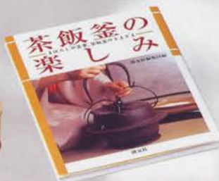
6-109 茶飯釜の楽しみ 淡交社刊 ¥2,057 (本体¥1,905)