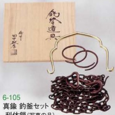
6-105 真鍮 釣釜セット 利休鎖 (写真の品) (釣手 哲匠作) 田中敏孝作 (桐箱) ¥46,872 (本体¥43,400)