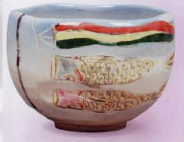
2-101 茶碗 鯉のぼり 吉村楽入作(桐箱) ¥23,760 (本体¥22,000)