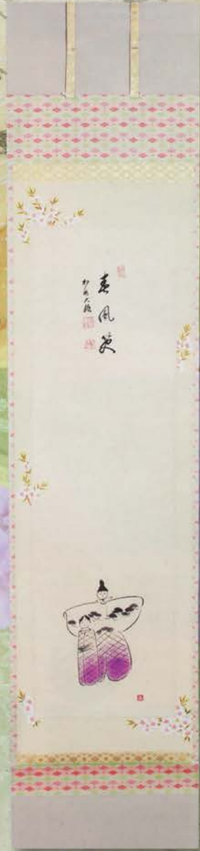
0-101 軸 一行物立雛の絵「春風笑」桃の絵書表具 相国寺派管長 有馬頼底師貫(桐箱) ¥175,000 (本体¥162,000)