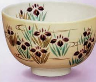
2-117 茶碗 雲母金 あやめ流水 中村与平作(化粧箱) ¥8,251 (本体¥7,640)