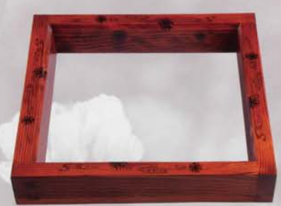
6-125 炉縁 摺漆 海松波 村田宗覚作 (桐箱) ¥95,040 (本体¥88,000)