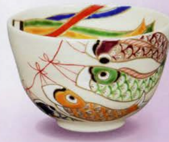
2-115 茶碗 仁清 鯉のぼり 水出宋絢作(化粧箱) ¥8,197 (本体¥7,590)