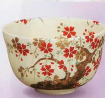
1-119 茶碗 仁清 枝垂桜 宮地英香作(化粧箱) ¥5,400 (本体¥5,000)