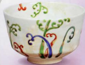
2-106 茶碗 粉引 藤 老休窯(桐箱) ¥16,524 (本体¥15,300)