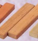
6-123 透木板 桜の木 竺叟好写 (紙箱) ¥2,408 (本体¥2,230)