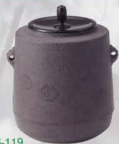
6-119 筒釜 唐松地紋 菊地政光作 (桐箱) ¥75,000 (本体¥69,444)