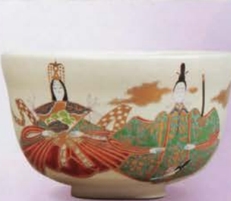
1-109 茶碗 仁清 内裏雛 宮地英香作(化粧箱) ¥5,832 (本体¥5,400)