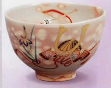
2-108 茶碗 乾山 兜 巖窯(桐箱) ¥15,012 (本体¥13,900)