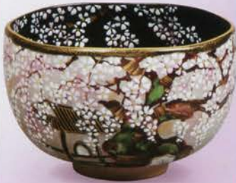
1-107 茶碗 乾山 九重桜 志休齋(桐箱) ¥19,872 (本体¥18,400)