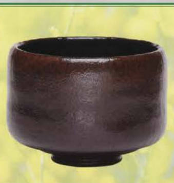
5-109 黒楽茶碗 万代屋黒 利休所持 宗安伝来写 佐々木昭楽作(桐箱) ¥43,632 (本体¥40,400)