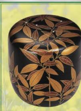
5-108 伝来写 笹絵棗 塚本規義作(桐箱) ¥85,536 (本体¥79,200)

利休所持の蒔繪茶箱に仕込まれたるの棗で大棗と中棗の間の寸法で千家伝来として世にいられています。