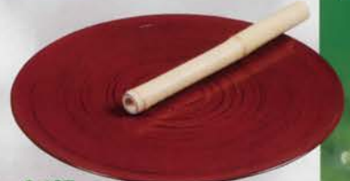
6-107 火吹竹 (紙箱) ¥1,663 (本体¥1,540)