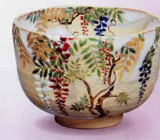
2-109 茶碗 乾山 掛流し 藤 山岡善高作(桐箱) ¥21,816 (本体¥20,200)