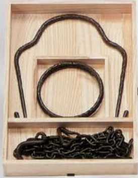
6-103 釣釜セット 利休鎖 (写真の品) 田中敏孝作 (桐箱) ¥60,048 (本体¥55,600)