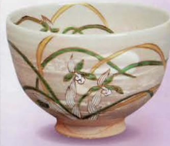
2-110 茶碗 刷毛目 蘭 巖窯(桐箱) ¥13,392 (本体¥12,400)