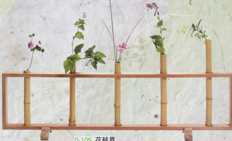
0-105 花結界 (縦3.5×横96×高さ24cm) ¥15,444 (本体¥14,300)