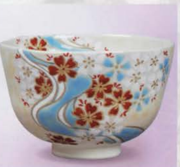
1-112 茶碗 御本 桜流水 伊坂清香作(化粧箱) ¥7,484 (本体¥6,930)