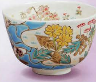
2-113 茶碗 御本 春野 伊坂清香作(桐箱) ¥15,444 (本体¥14,300)