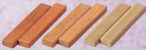
6-124 透木板 梅の木 圓能斎好写 (紙箱) ¥2,408 (本体¥2,230)