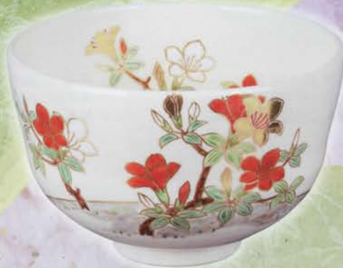
0-102 茶碗 仁清 つつじ 限定5個 木場紅園作(桐箱) ¥85,104 (本体¥78,800)