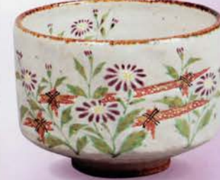
2-105 茶碗 灰釉 都忘れ 中村良二作(桐箱) ¥19,980 (本体¥18,500)