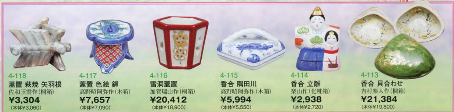
4-118 蓋置 萩焼 矢羽根 佐和玉雲作(桐箱) ¥3,304 (本体¥3,060)