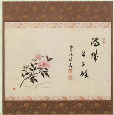
4-106 軸 横物 牡丹の絵「満城公子酔」 限定5本 福本積應師賛(桐箱) ¥55,620 (本体¥51,500)