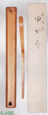
5-105 ゆがみ茶杓 利休写 竹憲作(桐箱) ¥21,384 (本体¥19,800) 限定10本