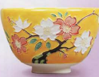
1-105 茶碗 黄交趾 桜 谷口菁嵐作(桐箱) ¥21,384 (本体¥19,800)