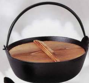
6-117 鉄鍋 大 (杓子付) (φ24cm×H9cm) (化粧箱) ¥16,524 (本体¥15,300)