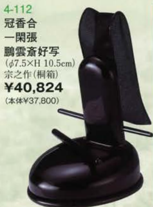
4-112 冠香合 一閑張 鵬雲斎好写 (φ7.5×H 10.5cm) 宗之作(桐箱) ¥40,824 (本体¥37,800)