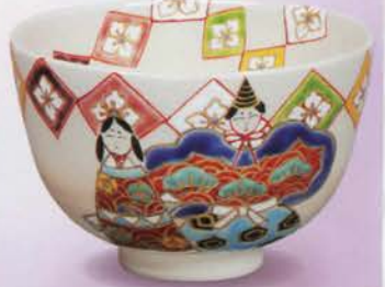
1-104 茶碗 御本 雛に花菱 伊坂清香作(桐箱) ¥15,444 (本体¥14,300)