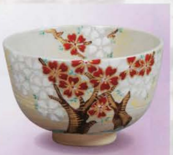
1-116 茶碗 刷毛目 桜 中山喜白作(化粧箱) ¥5,778 (本体¥5,350)