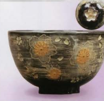
1-115 茶碗 黒三島 夜桜 桜高台 中村与平作(化粧箱) ¥7,128 (本体¥6,600)