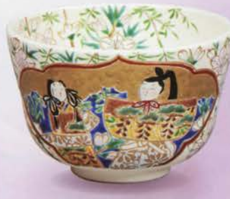
1-102 茶碗 仁清 雛 加藤如水作(桐箱) ¥28,512 (本体¥26,400)