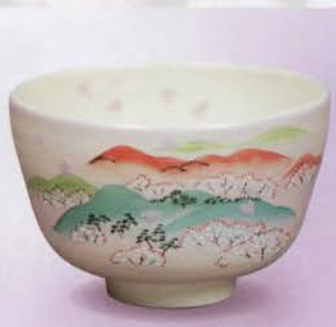
1-113 茶碗 淡桃 吉野山 中村与平作(化粧箱) ¥8,251 (本体¥7,640)