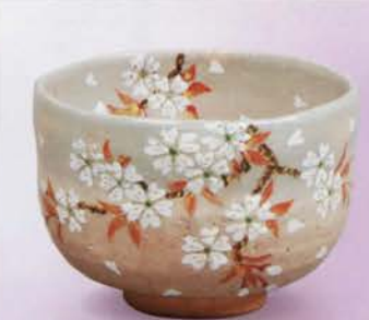
1-111 茶碗 乾山 桜花 山岡善高作(桐箱) ¥14,796 (本体¥13,700)