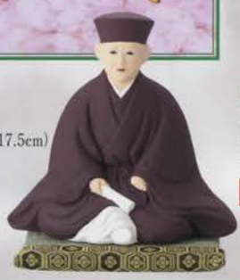
5-107 利休座像 (畳付) (縦18.5×横13.8×H 17.5cm) 栞山作(桐箱) ¥11,880 (本体¥11,000)

利休所持の蒔繪茶箱に仕込まれたるの棗で大棗と中棗の間の寸法で千家伝来として世にいられています。