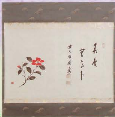
4-103 軸 横物 椿の絵「春色無高下」 限定5本 福本積應師賛(桐箱) ¥55,620 (本体¥51,500)