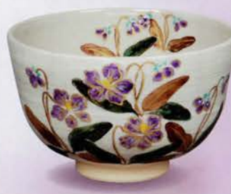
2-119 茶碗 刷毛目 すみれ 中山喜白作(化粧箱) ¥5,778 (本体¥5,350)