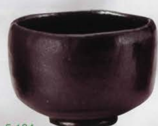
5-104 茶碗 大黒 長次郎写 佐々木昭楽作(桐箱) ¥21,168 (本体¥19,600)