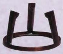
6-113 唐銅蓋置 五徳 金谷浄雲作 (桐箱) ¥12,960 (本体¥12,000)