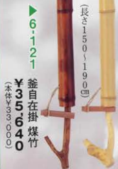
6-121 釜自在掛 煤竹 (長さ150〜190mm) (本体¥33,000) ¥35,640