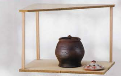
5-115 山里棚 桐木地 竹張砂擦(写真の品) 小林幸齋作 ¥46,656 (本体¥43,200)