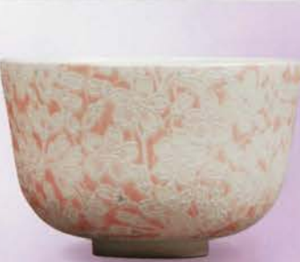
1-110 茶碗 浮き絵 桜 花月齋(化粧箱) ¥4,298 (本体¥3,980)