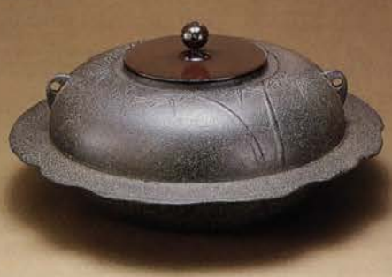
6-127 透木釜 竹地紋 菊地政光作 (桐箱) ¥118,000 (本体¥109,259)