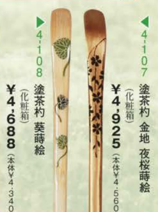
4-108 塗茶杓 葵蒔絵 (化粧箱) ¥4,688 (本体¥4,340)