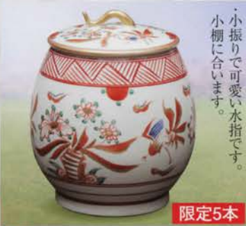
7-118 水指 山吹 (φ15.8×H16cm) 文月和香作(桐箱) 定価¥47,520→ 特價¥33,200