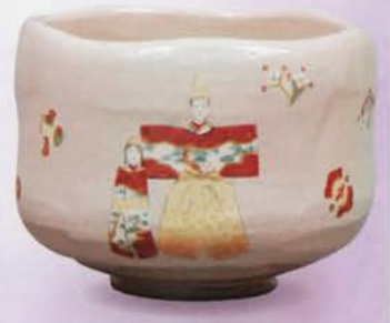
1-101 茶碗 立雛 吉村楽入作(桐箱) ¥26,676 (本体¥24,700)