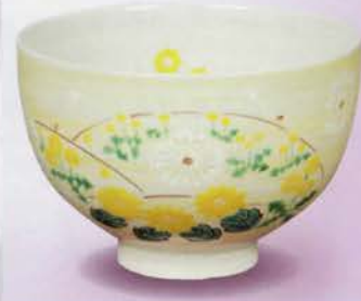
2-114 茶碗 御本 タンポポ 見谷福峰作(化粧箱) ¥5,443 (本体¥5,040)