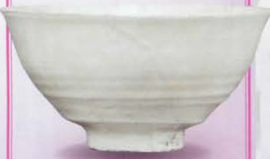
2-107 茶碗 粉引「花のしら河」 原清晃作(桐箱) ¥17,064 (本体¥15,800)