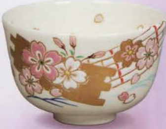
1-106 茶碗 仁清 花筏 山本夢作(桐箱) ¥20,520 (本体¥19,000)