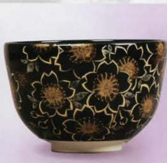
1-114 茶碗 黒仁清 金彩桜 水出宋絢作(化粧箱) ¥8,553 (本体¥7,920)