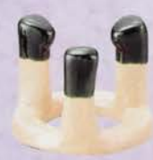
6-114 五徳蓋置 川崎和楽作 (木箱) ¥7,938 (本体¥7,350)