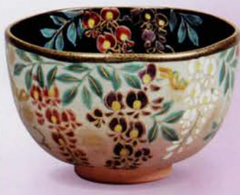
2-103 茶碗 乾山 藤 老休窯(桐箱) ¥19,872 (本体¥18,400)