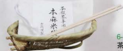
6-111 茶飯用 竹ざる (箸付) (19.5×23×H 5.5cm) (化粧箱) ¥3,607 (本体¥3,340)