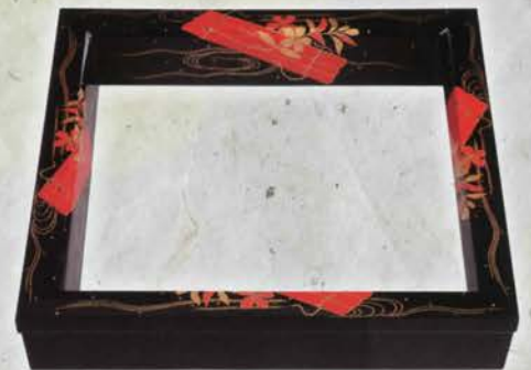
0-104 炉縁 花筏蒔絵 宗旦好写 限定3本 角出俊平作(桐箱) ¥356,400 (本体¥330,000)