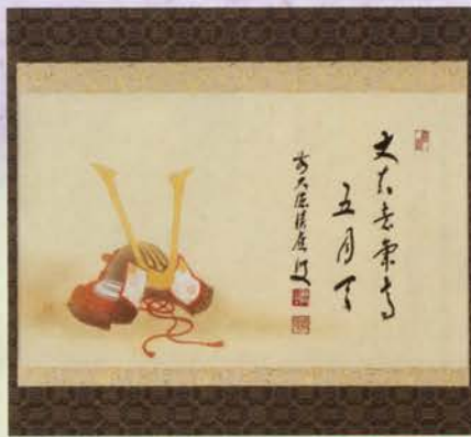
4-102 軸 横物 兜の絵「丈夫意気高五月天」 限定5本 福本積應師賛(桐箱) ¥55,620 (本体¥51,500)