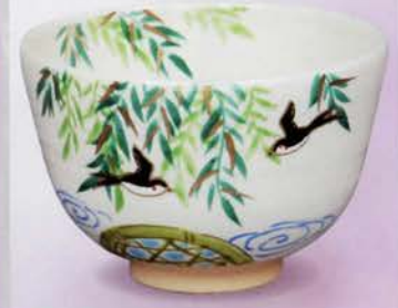
2-116 茶碗 白釉 柳に燕 田中香泉作(化粧箱) ¥6,264 (本体¥5,800)