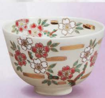
1-118 茶碗 仁清 金雲桜 田中香泉作(化粧箱) ¥6,264 (本体¥5,800)