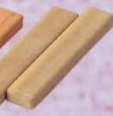
6-122 透木板 朴の木 利休好写 (紙箱) ¥2,408 (本体¥2,230)