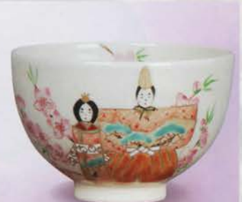
1-108 茶碗 御本 立雛 見谷福峰作(化粧箱) ¥5,443 (本体¥5,040)