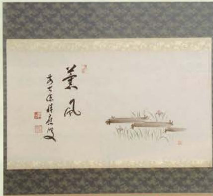
4-105 軸 横物 ハッ橋の絵「薰風」 限定5本 福本積應師賛(桐箱) ¥55,620 (本体¥51,500)