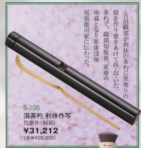
5-106 涙茶杓 利休作写 竹憲作(桐箱) ¥31,212 (本体¥28,900)